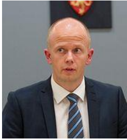
Holden: Årade domare